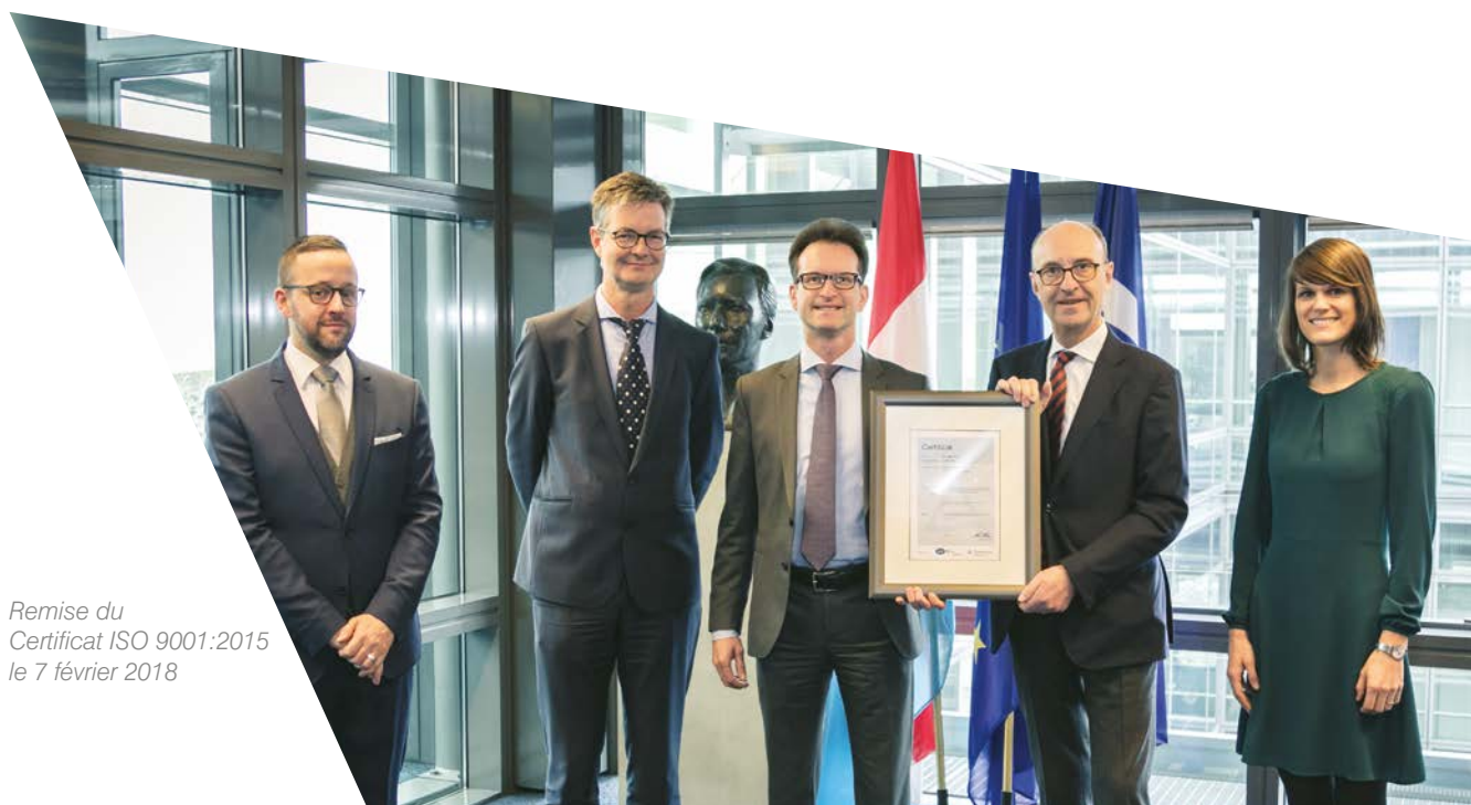
Remise du Certificat ISO 9001:2015 le 7 février 2018

Notre démarche d'amélioration continue intègre également notre engagement en faveur du développement durable. La Chambre de Commerce est détentrice du label «Entreprise Socialement Responsable» (ESR) octroyé par l'INDR.